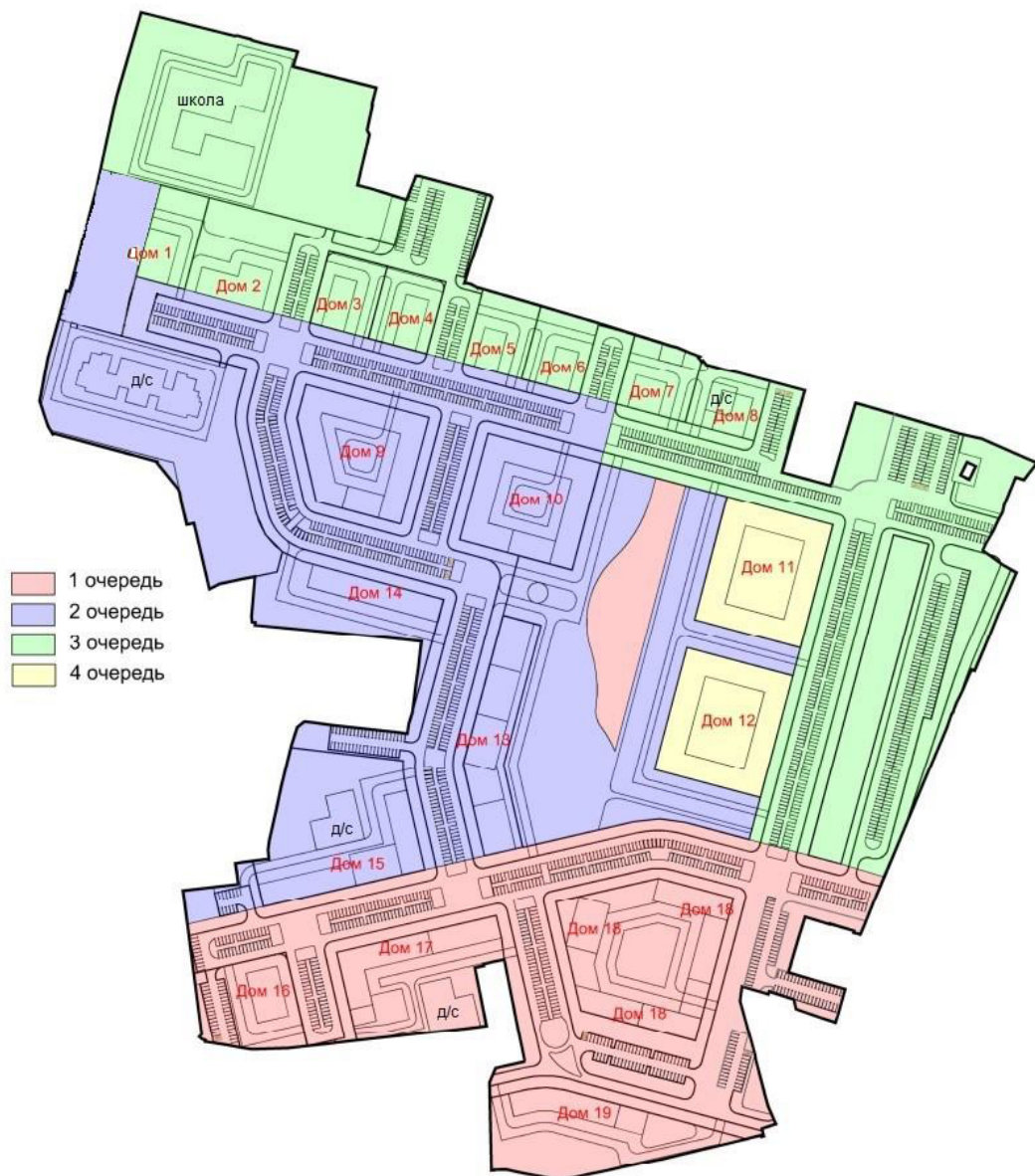
Рис. 5.1 – Очередность строительства застройки территории КРТ.

На рис. 5.1. отображена очередность строительства в соответствии с таблицей 5.5.